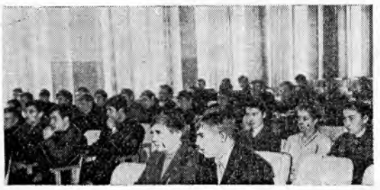
Слушатели подготовительного отделения на своем первом собрании в актовом зале института.