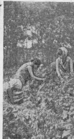
● На уборке смородины.

На наших снимках вы видите лишь несколько моментов большого, насыщенного летней работой трудового студенческого лета в учхозе.