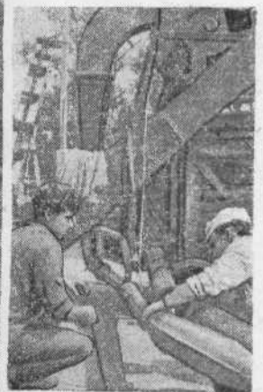
● Сложную технику студенты ремонтируют сами.