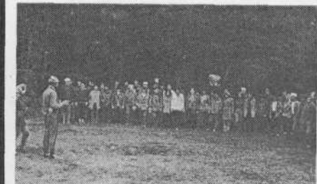
Идет сдача норм комплекса ГТО. НА СНИМКЕ: участники туристского похода на старте.