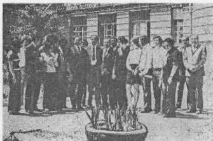
Недавно гостями нашего института были члены молодежной революционной организации Палестины. Они познакомились со структурой комсомольской организации института, с формами работы с молодежью. НА СНИМКЕ: делегация палестинской молодежи во время пребывания в институте.