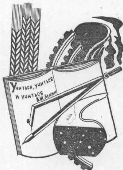
Рисунок С. ЛИХОДЕДА, студента II курса зоотехнического факультета.

Комсомолец, вступаая в нее, помни, что твои задачи на годы учебы в институте — это: отличной учебной и ударным трудом способствовать выполнению задач, поставленных XXIV