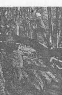
На соревнованиях по спортивному ориентированию.