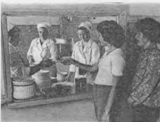
Студенты довольны отличным обслуживанием.