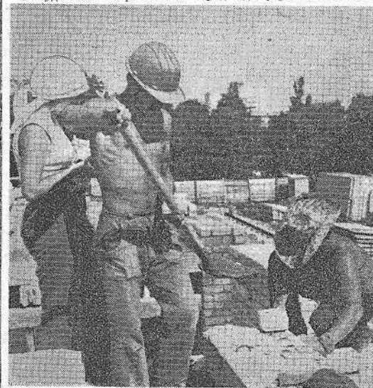
Бойцы ССО «Юность-76» на строительном объекте.