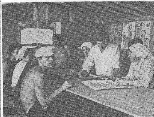
В студенческом строительном отряде идет утренняя планерка.